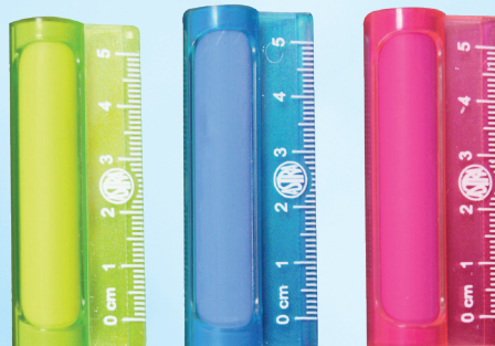
2w1 GUMKI + LINIJKI