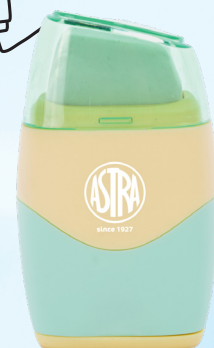
2w1 GUMKI + TEMERÓWKI