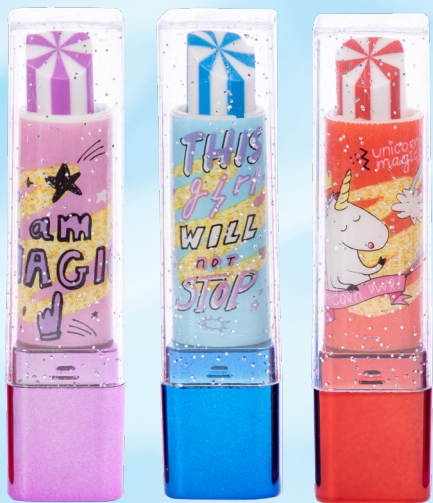
ZAPACHOWE GUMKI W Kształcie SZMINKI