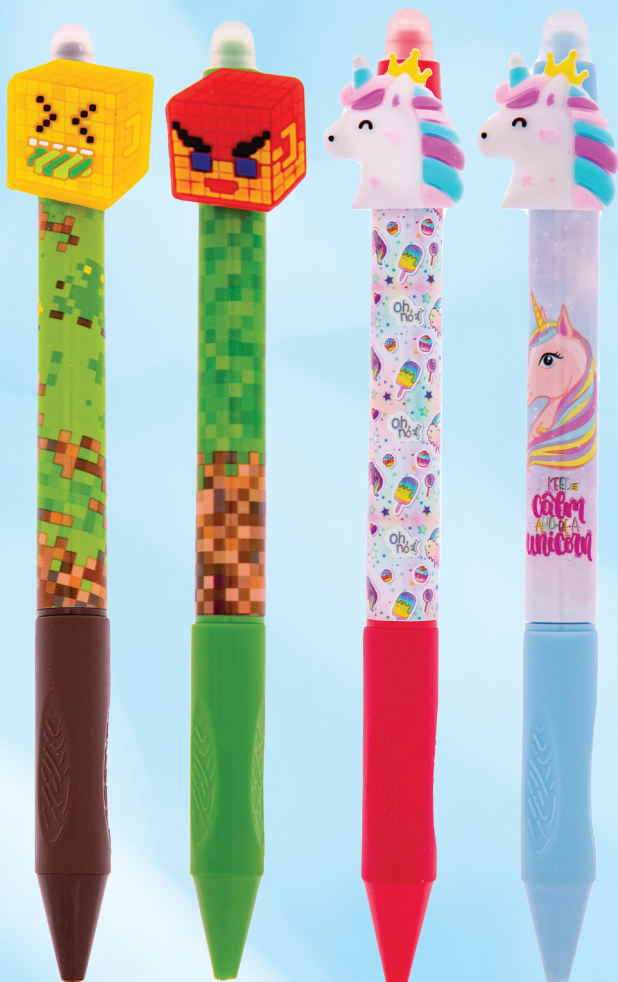
DŁUGOPIS WYMAZYWALNE Z GUMOWYM UCHWYTEM